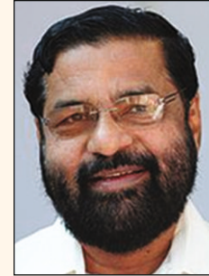
ശ്രീ. കടകംപള്ളി സുരേന്ദ്രൻ ബഹു. ടൂറിസം ദേവസ്വം സഹകരണ വകുപ്പ് മന്ത്രി

തിരുവനന്തപുരം ജില്ലാപഞ്ചായത്തിന്റെ നേതൃത്വത്തിൽ തിരുവനന്തപുരം ജില്ലയിലെ പൊതുവിദ്യാലയങ്ങളിലെ എല്ലാ ക്ലാസ്സിലും ലൈബ്രറി സജ്ജീകരിക്കുന്ന “സർഗ്ഗവായന സമ്പൂർണ്ണ വായന” എന്ന നൂതന പദ്ധതിയ്ക്ക് എല്ലാവിധ ആശംസകളും നേരുന്നു.