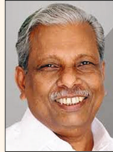
ശ്രീ. എ.സി മൊയ്തീൻ ബഹു. തദ്ദേശ സ്വയം ഭരണ വകുപ്പ് മന്ത്രി