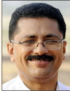
ശ്രീ. കെ. ടി. ജലീൽ ബഹു. ഉന്നത വിദ്യാഭ്യാസ ന്യൂനപക്ഷക്ഷേമ വകുപ്പ് മന്ത്രി